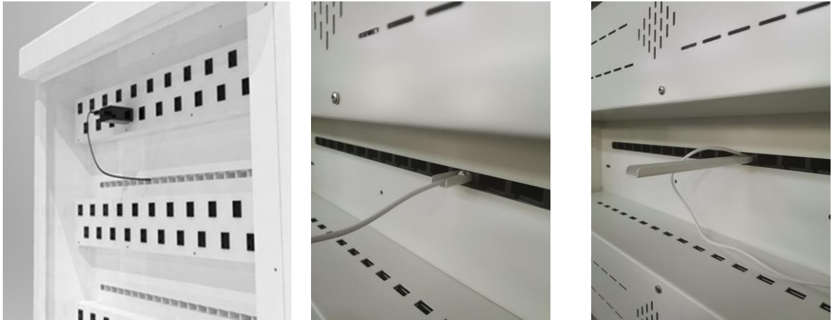
图1 将充电器插入后门内的插座内，对齐隔板下端过线孔，插入导槽，充电线沿导槽插入，直到充电头穿过隔板到达前腔体，然后拔出导线槽。

检查设备总开关是否处于绿色指示灯亮起状态，打开前柜门检查平板电脑是否处于充电状态。