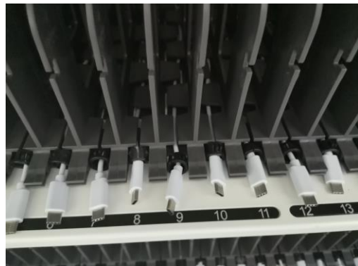
图3 依次将所有充电线安装好

注：如遇整机设备不通电的情况，请先检查插座区右下角断路器是否跳闸。跳闸请按下断路器蓝色按钮，然后合闸通电。